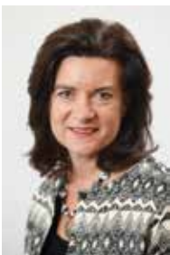
Eluned Morgan AM

Gweithgor ydy grŵp o bobl sydd yn dod at ei gilydd i wneud gwaith ar rhywbeth arbennig.