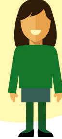
Grace Krause Swyddog Polisiau