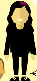
Taylor Florence Cynorthwy-ydd Gweinyddol