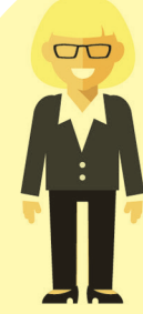
Cheryl White Gweinyddwr